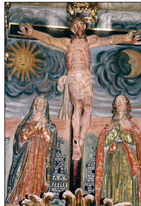
Calvario en el retablo mayor. Torrelapaja

Celebramos a Cristo resucitado que nos abre el camino de la vida nueva.